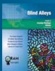
Part. II, Mexique Anglais, espagnol, français