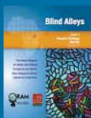
Part. II, Ouganda Anglais, français