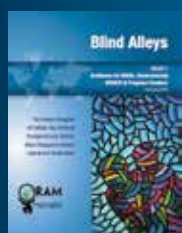
Part. I, Conseils Anglais, espagnol, français