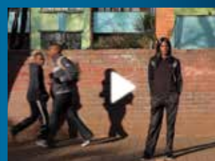
Vidéos « No Place for Me » Anglais