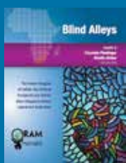
Part. II, Af. du Sud Anglais, français