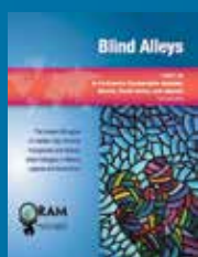
Part. III, Synthèse Anglais,